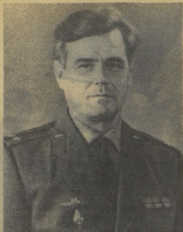
Командир космического корабля «Союз-12» Василий Григорьевич ЛАЗАРЕВ.

27 сентября 1973 года в 15 часов 13 минут по московскому времени на орбиту спутника Земли был выведен новый советский космический корабль «Союз-12». Командир корабля — подполковник Лазарев Василий Григорьевич, Бортинке-нер — Макаров Олег Григорьевич. С экипажем «Союза» поддерживалась устойчивая радио- и телевизионная связь.