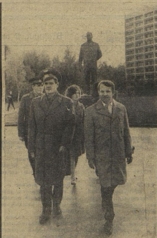
Василий Григорьевич Лазарев и Олег Григорьевич Макаров снова шагают по улицам Звёздного городка. Хорошо вернуться домой к родным, друзьям, товарищам...