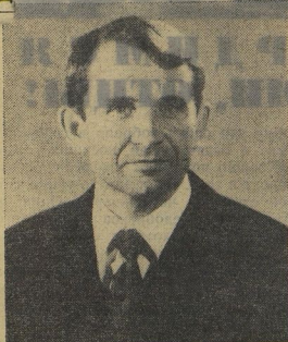
Бортникер космического корабля «Союз-12» Олег Григорьевич МАКАРОВ.

30 сентября Москва тепло встретила космонавтов.