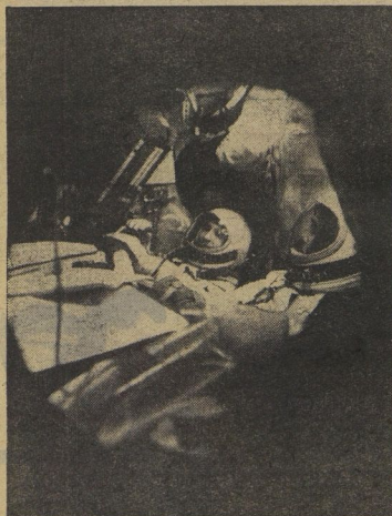
Прежде чем отправиться в космический рейс, Василий Григорьевич Лазарев и Олег Григорьевич Макаров много часов «играли» в Центре подготовки космонавтов имени Ю. А. Гагарина. Вы видите экипаж «Союза-12» на тренировке.

Краснодарский край, станция Некрасовская, школа № 12.